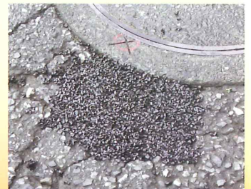
マンホール廻りの補修