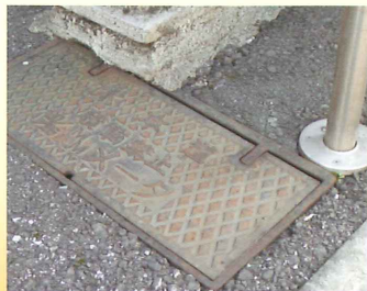
メーターボックス廻りの補修